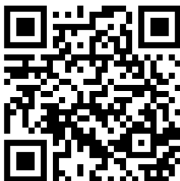
虛擬鑰匙 APP 下載